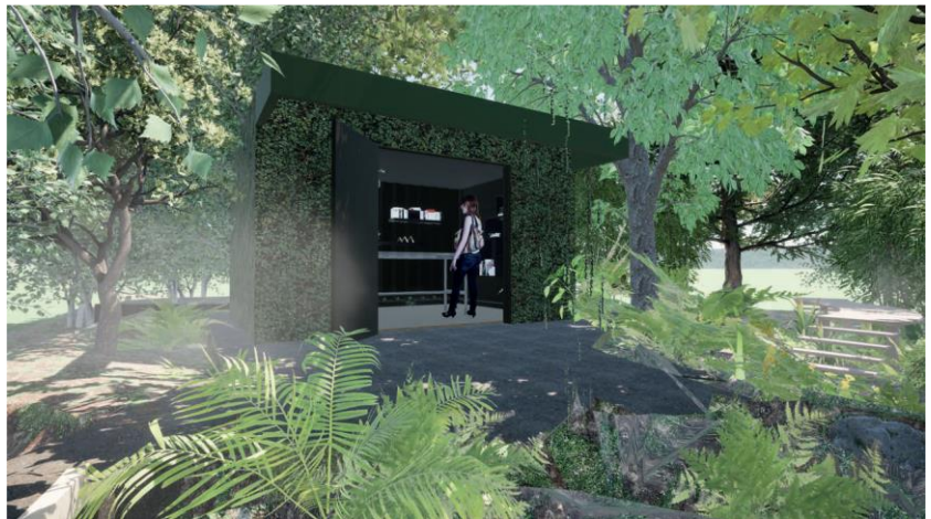
Artist impression gemaakt door Ilse Snoeren

Na de inrichting/verhuizing van de winkelinventaris wordt de huidige winkel gesloopt;